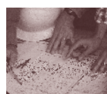
Techniques & développement durable