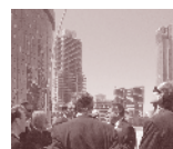
Visites et séjours d'étude