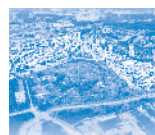
Immobilier, urbanisme et aménagement