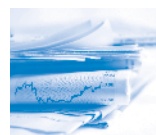
Finance & fiscalité