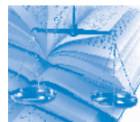
Droit & éthique