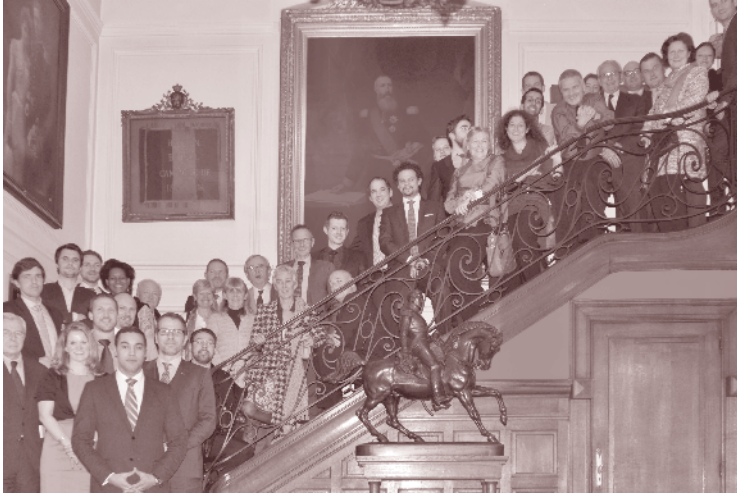
Photo : Proclamation de la deuxième promotion EMI (2012-2014)